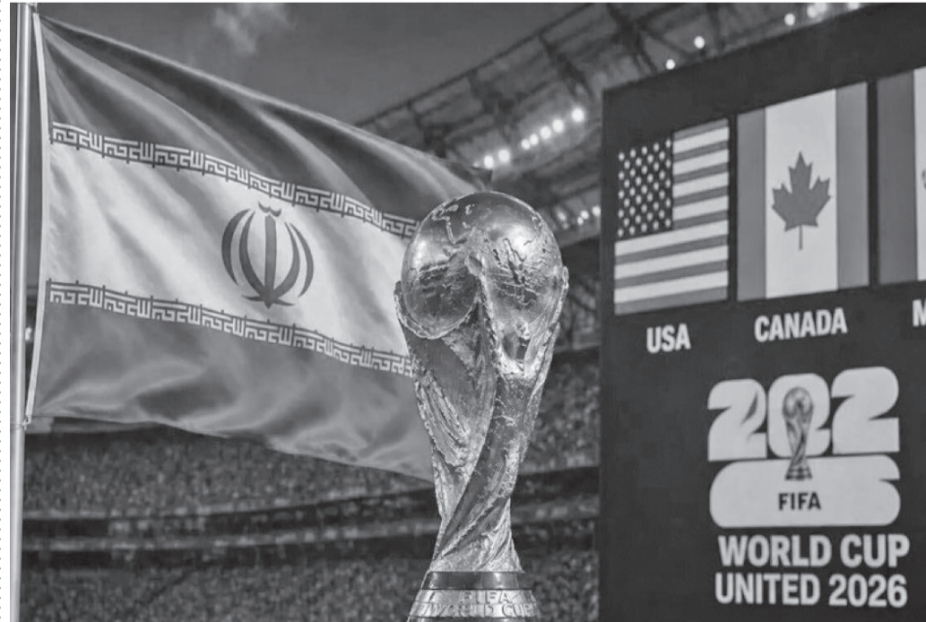
نبض البلد - وكالات

وهيوسن في يوم الاستقلال فعاليات تكريمية تحت شعار «أمريكا ٢٥٠»، ضمن احتفالات الذكرى الـ ٢٥٠ لتأسيس البلاد. وترتبط هذه المبادرة بالجهود المستمرة التي تبذلها إدارة دونالد ترامب رئيس الولايات المتحدة بربط الأحداث الرياضية الكبرى باحتفالات الذكرى الوطنية. وكان جيانى إنفانتينو قد حافظ على