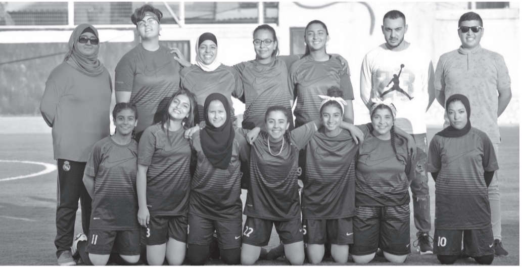
نبض البلد - وكالات

مثل التمرير، والتنسيق، والعمل الجماعي. لكن التدريب لم يتوقف عند الجانب الرياضي فقط، بل شمل أيضاً تطوير مهارات حياتية أساسية، مثل التواصل، والانضباط، والعمل ضمن فريق، وبناء الثقة بالنفس. هذا النهج الشامل يهدف إلى إعداد الفتيات ليكن أكثر قدرة على مواجهة التحديات داخل الملعب وخارجه. المشاركة في مؤتمر دولي على هامش البطولة إلى جانب المنافسات الرياضية، ستشارك الفتيات في مؤتمر دولي يُعقد على هامش البطولة، يجمع أطفالاً من مختلف دول العالم، إلى جانب ممثلين عن مؤسسات دولية وصناع قرار.