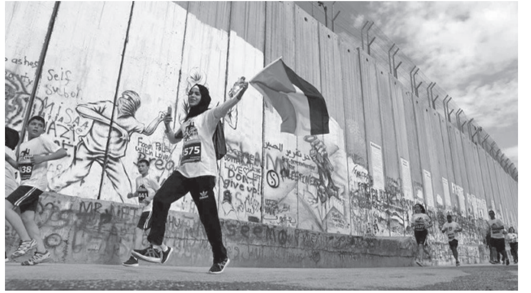
نبض البلد - وكالات

غزة سباقاً موازياً انطلق من جسر وادي غزة باتجاه الشمال على طول الطريق الساحلي، بمشاركة قدرت بنحو ٢٥٢٢ متسابقاً. وضم الماراثون مشاركين من جنسيات مختلفة، إلى جانب حضور مميز للأطفال والنساء، مما أضفى صبغة جماهيرية واسعة على هذا الحدث الرياضي الذي يتحدى الحصار المفروض على القطاع.