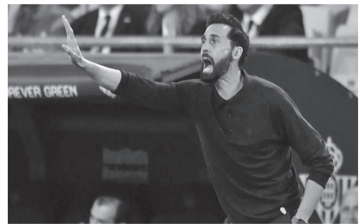
نبض البلد - وكالات

مرحلة جديدة، وأن تمنحهما فرصة مواصلة الكفاح من أجل هذا النادي. أنا فخور بهما للغاية. لكن أربيلوا أظهر غضبه في المقابل من «تسريب»، ما حدث في مران ريال مدريد لوسائل الإعلام. وقال مدرب ريال مدريد، «لدي صديق أخذ مضرب غولف وضرب به صديقاً آخر على رأسه، يحدث هذا. لكن المهم، أن هذه الأشياء يجب ألا تخرج من غرفة الملابس».