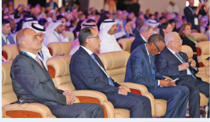
نبض البلد - الرياض

مندوباً عن جلالة الملك عبدالله الثاني، شارك رئيس الوزراء الدكتور بشر الخصاونة في افتتاح الاجتماع الخاص للمنتدى الاقتصادي العالمي الذي بدأ أعماله صباح أمس الأحد، في مركز الملك عبدالعزيز الدولي للمؤتمرات في الرياض برعاية سمو الامير محمد بن سلمان ولي العهد