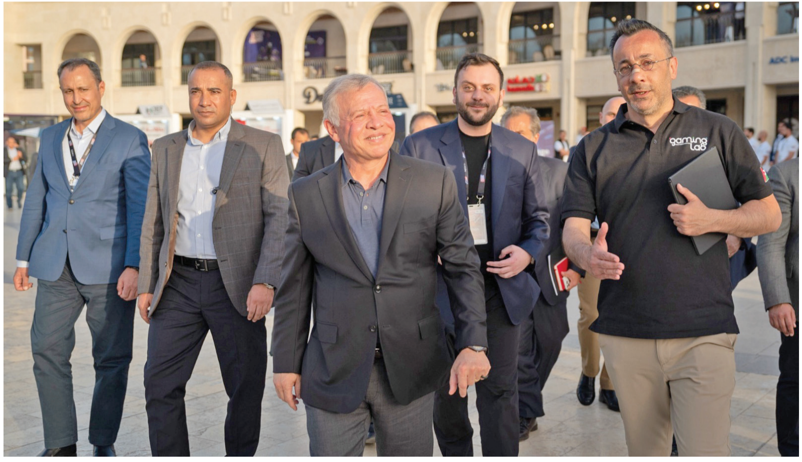
نبض البلد - العقبة

رعى جلالة الملك عبدالله الثاني، أمس الأحد، اختتام فعاليات مؤتمر مستقبل الرياضات الإلكترونية، التي ركزت على أحد أبرز القطاعات الواعدة لتشغيل الشباب ودعم الاقتصاد الوطني. واستمع جلالتة إلى إيجاز عن نتائج النقاشات والجلسات