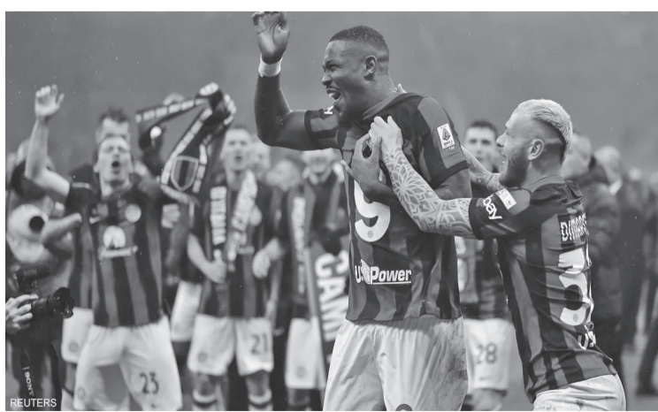
مع بقاء خمس جولات في البطولة.

توج إنتر بلقبه في ٢٠ في دوري الدرجة الأولى الإيطالي لكرة القدم بفوزه ١-٢ على غريمه ومضيفه ميلان ليوسع فريق المدرب سيموني إنزاجي فارقا يصعب تعويضه أمام أقرب مطارديه في جدول الترتيب. ويتفوق إنتر، الذي خسر مرة واحدة فقط في الدوري هذا الموسم، بفارق ١٧ نقطة على ميلان صاحب المركز الثاني قبل خمس مباريات من النهاية. حتى الأمطار الغزيرة لم تؤثر على معنويات مشجعي النيرازوري في سان سيرو حيث استعادوا بكل سعادة حقوق التفخر بالمدنية. سجل فراثيسكو أتشيري وماركوس تورام للإنتر، وعلى الرغم من أن هدف فيكايو توموري المتأخر ميلان هدد بتأخير الاحتفالات، إلا أن إنتر حافظ على الفوز الذي وسع تقدمه إلى ١٧ نقطة لا يمكن لميلان صاحب المركز الثاني التغلب عليها،