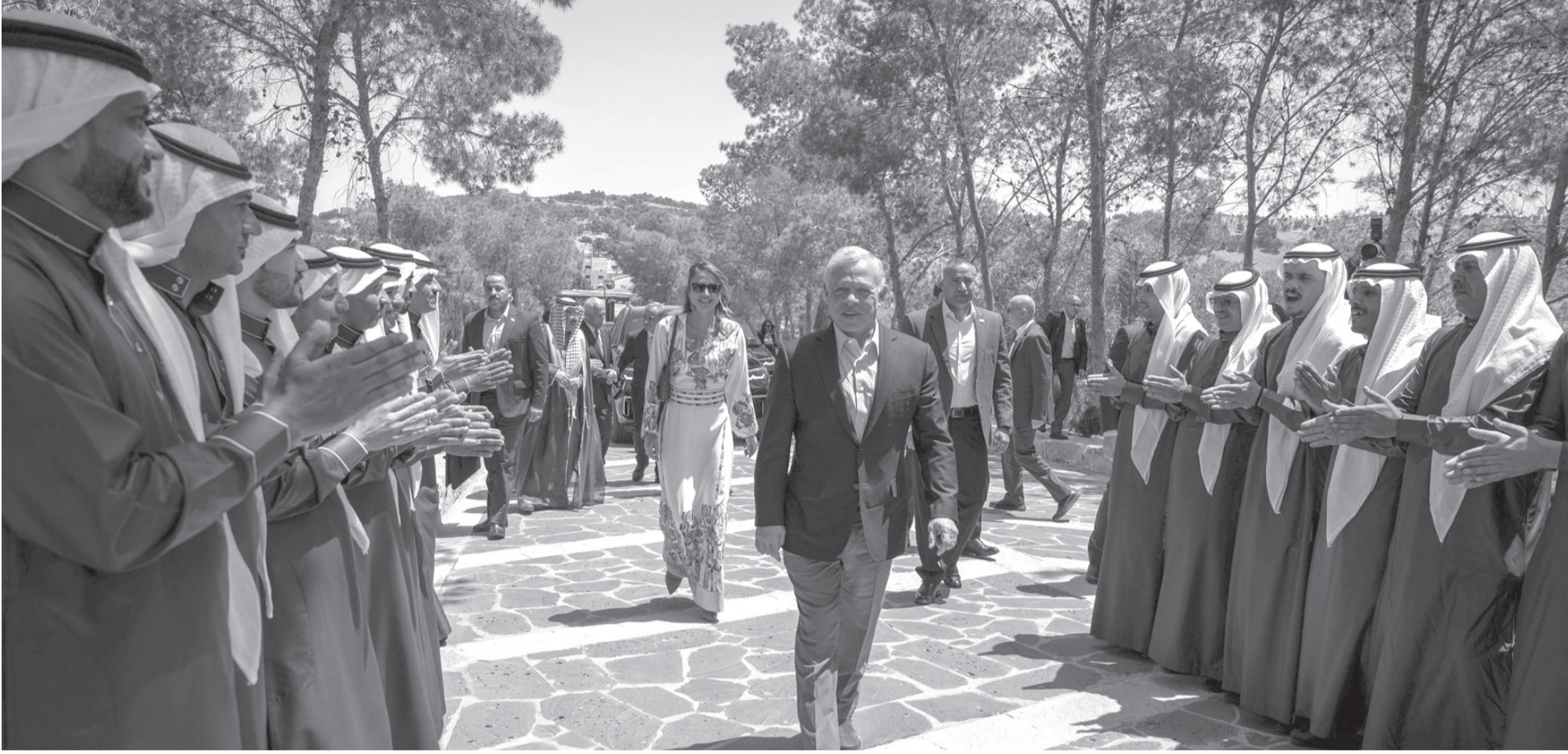
نبض البلد - مادبا

أكد جلالة الملك عبدالله الثاني أن الأردن يثبت دائما قدرته على النجاح بعزيمة الأردنيين وإصرارهم. وشهد جلالته الملك، خلال لقائه وجهاء وممثلين عن أبناء محافظة مادبا، أمس الاثنين، بحضور جلالة الملكة رانيا العبدالله، على أن مادبا تمثل رمزا للعيش المشترك والعطاء، وتعكس صورة مثالية للتنوع في الأردن. وبين جلالته في اللقاء، الذي عقد بموقع جبل نيبو بمناسبة اليوبيل الفضي، أن المكانة التاريخية والدينية للمحافظة تدفعنا لتحقيق إنجازات جديدة فيها، خاصة في قطاع السياحة، مشيرا إلى أهمية أن يستفيد أبناءها وبناتها من الفرص المتاحة. وأشاد جلالته الملك بالجهود التنموية المستمرة بمادبا في جميع القطاعات، خصوصا في قطاع الزراعة، معربا عن اعتزازه بما تضمه المحافظة من منارات علم ومؤسسات تعليمية، والتي تشكل مصدر فخر لكل الأردنيين. وقال جلالته، «فخور بوجودي بين إخواني وأخوانتي أهل مادبا العزيزة، في جبل نيبو الذي يمثل التاريخ والحضارة في بلدنا».