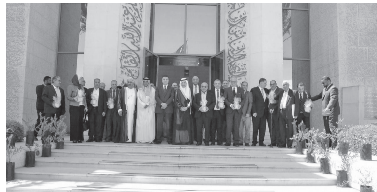
نضن البلد - عمان

أقامت سفارة المملكة العربية السعودية لدى المملكة الاثنتين فعالية بمناسبة يوم مبادرة السعودية الخضراء، تحت رعاية وزير الزراعة الأردني المهندس خالد حنيفات، بحضور عدد من المسؤولين والمختصين بقطاعي الزراعة والبيئة وعدد من السفراء العرب. وقال سفير خادم الحرمين الشريفين لدى الاردن نايف بن بندر السديري في كلمته بافتتاح أعمال الفعالية، إن مبادرة السعودية الخضراء التي أطلقها ولي العهد السعودي