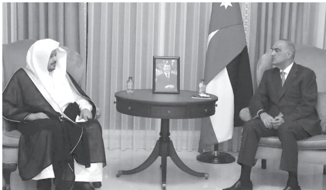
نبض البلد - عمان

أكد أهمية تعزيز التعاون في مجال الاستثمار