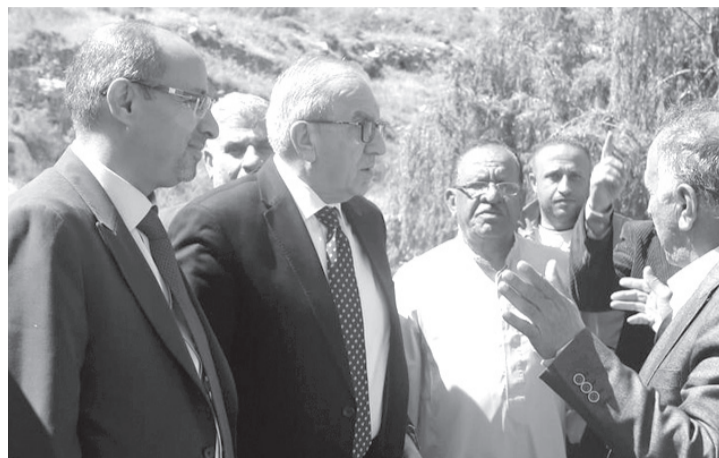
نبض البلد - عمان

وفي المنطقة الواقعة بين منطقتي الصناعة والظهير في لواء وادي السير، تفقد السمن مشروع مبنى مدرسة التدريبات الأساسية المختلطة والذي يخدم جمعا سكانيا كبيرا، حيث بوشر العمل في المدرسة أواخر العام 2022، وتتكون من مبنى 5 طوابق وبمساحة إجمالية تبلغ 6261 مترا مربعا، فيما بلغت تكلفة المشروع 2.9 مليون دينار، يتمويل بقرض من الصندوق السعودي للتنمية.