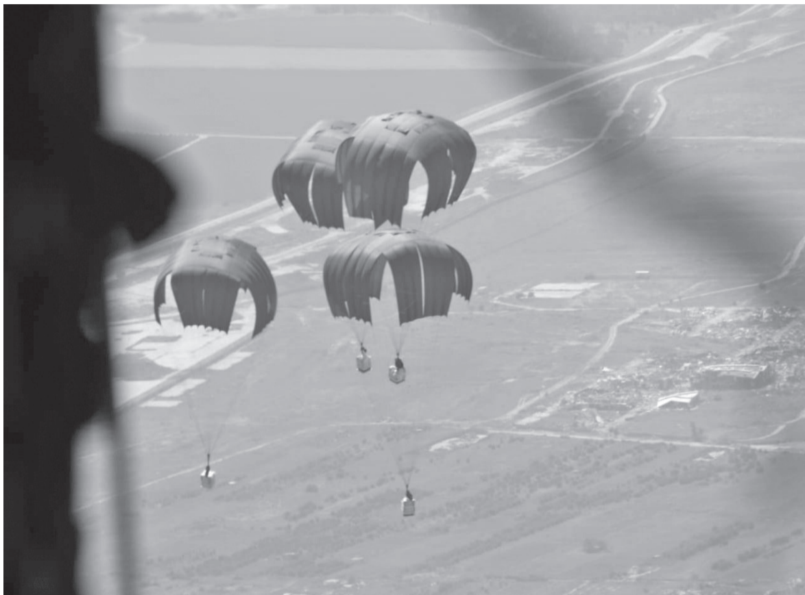
الإسرائيلي على القطار إلى ٨٣ إنزالاً جويًا أردنيًا، ١٨٦ إنزالاً جويًا بالتعاون مع دول شقيقة وصديقة.

وارتفع عدد الإنزالات الجوية التي نفذتها القوات المسلحة الأردنية - الجيش العربي، منذ بدء العدوان