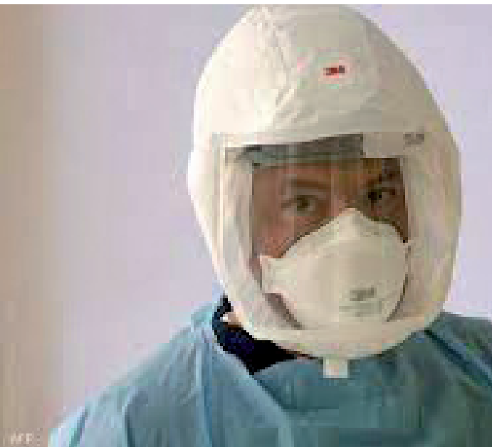
ترجمات - أبوظبى