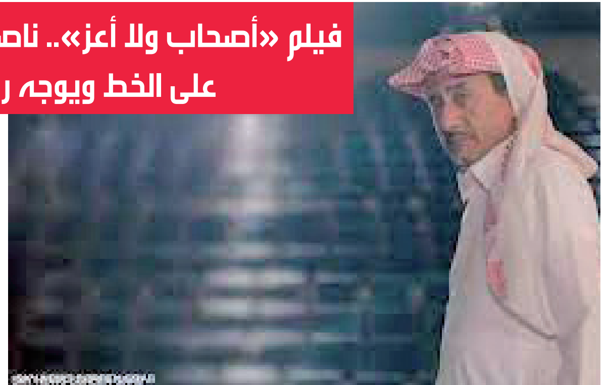
سكاى نيوز عربية - أبوظبى