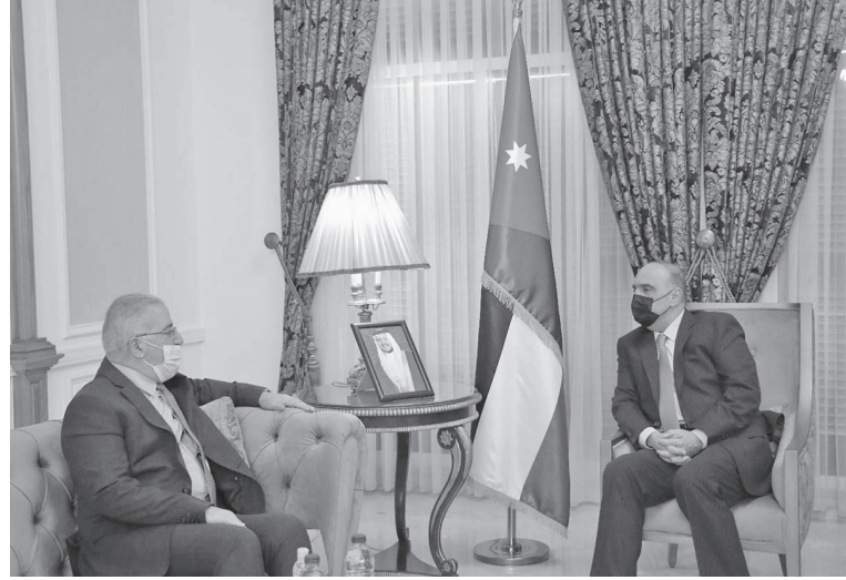
الشرقية وفي اطار حل الدولتين . ولفت الخصاونة إلى أن الأردن يضع امكانياته وخبراته في تصرف الاشقاء الفلسطينيين وبما يسهم في تعزيز صمود

استقبال رئيس الوزراء الدكتور بشر الخصاونة في رئاسة الوزراء امس الثلاثاء، وزير النقل الفلسطيني عاصم سالم بحضور وزير النقل المهندس وجيه عزازية.