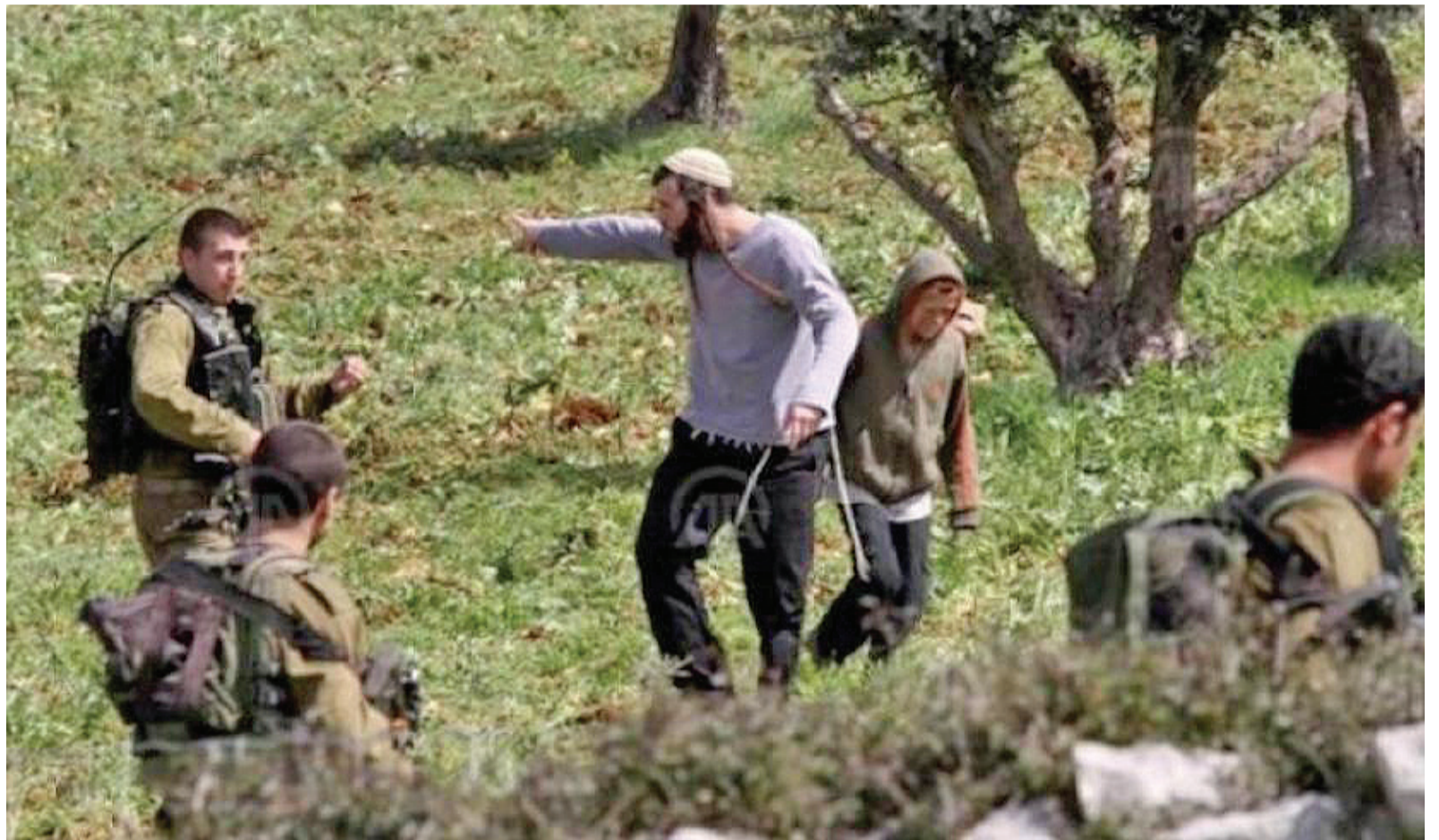
نبض البلد- وكالات

ظل حكومة وفرت الغطاء السياسي والأمني والقانوني لهدم المستوطنين سياسة منهجة يحظى بحماية رسمية. واعتبرت في بيان امس الأربعاء، أن هذه المعطيات تمثل اعترافاً إسرائيلياً رسمياً بتصاعد إرهاب المستوطنين واتساع نطاقه، في