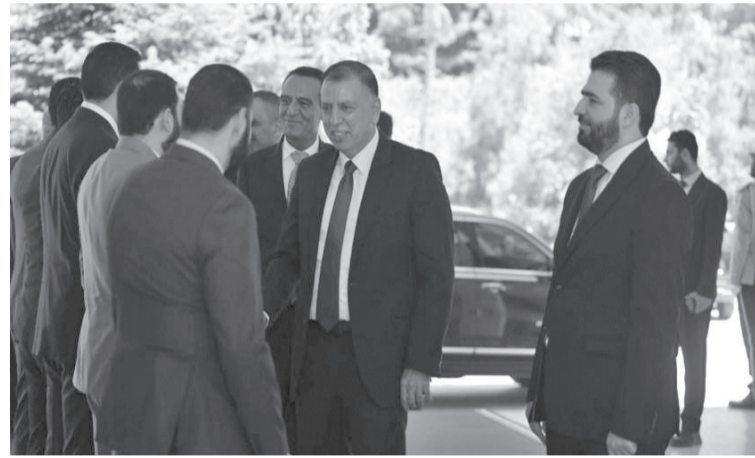
كما أدان الضراية التفجيرات الإرهابية، التي شهدتها العاصمة