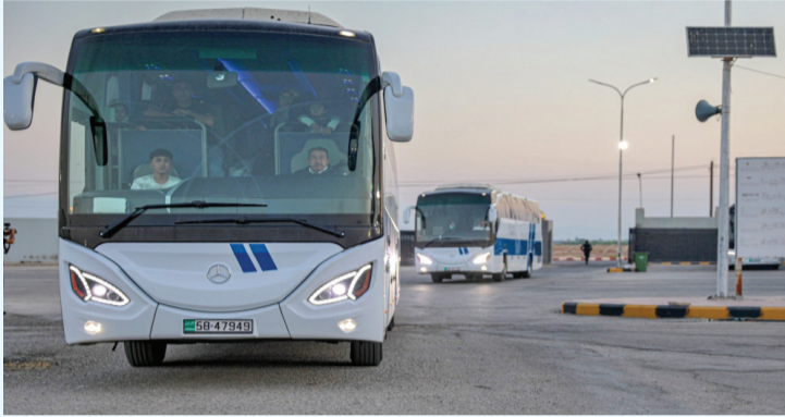
نبض البلد- عمان

وضمت الدفعة العائدة (26) طفلاً برفقة (54) من ذويهم، تلقوا خلال فترة وجودهم في المملكة الرعاية الطبية اللازمة وفق أعلى المعايير المعتمدة، بعد أن جرى إجلاؤهم سابقاً إلى الأردن من خلال القوات المسلحة الأردنية - الجيش العربي، وبالتعاون مع وزارة الصحة ومنظمة الصحة العالمية.