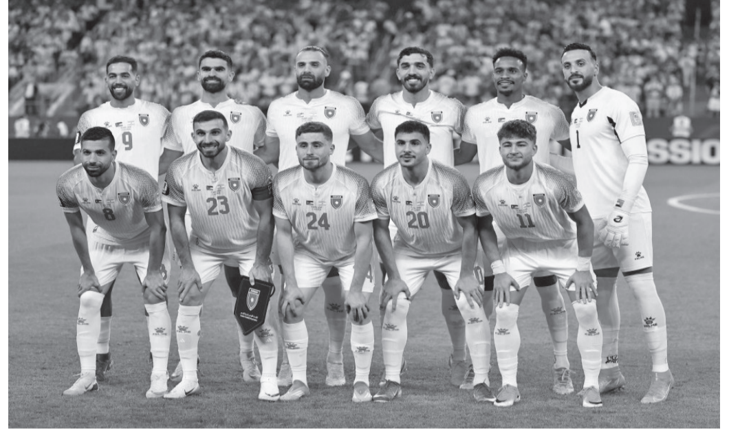
نضن البلد - عمان حصل المنتخب الوطني لكرة القدم على مكافأة مالية تبلغ ٩ ملايين دولار بعد مشاركته في نهائيات كأس العالم ٢٠٢٦، وفق إعلان للاتحاد الدولي لكرة القدم