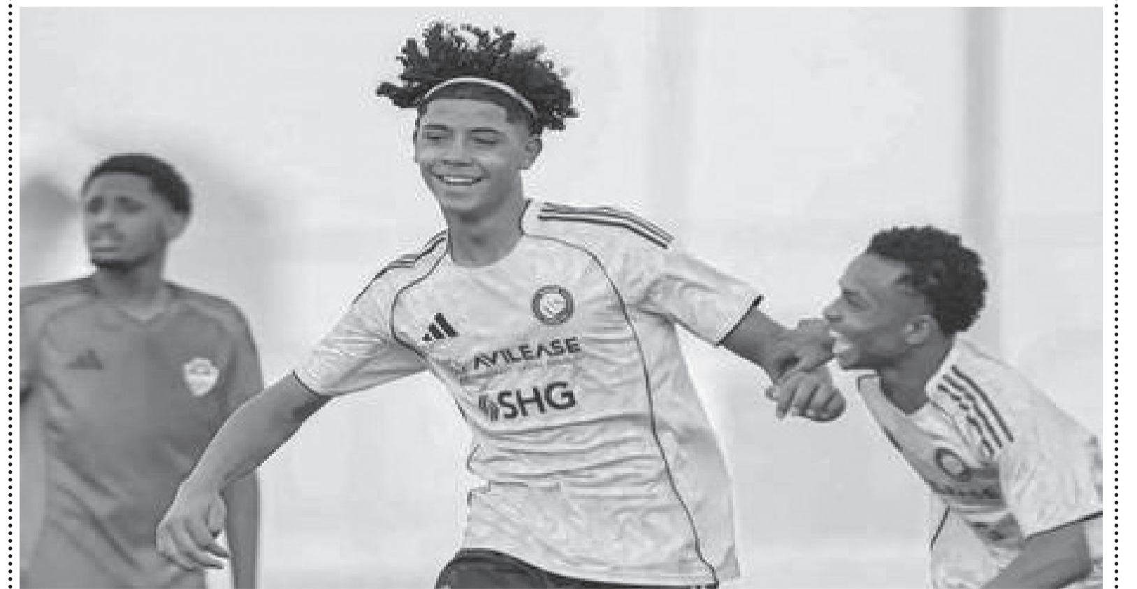
نبض البلد - وكالات

إلى احتمال انضمام الشاب إلى تشكيلة الفريق الأول في نادي النصر في وقت مبكر قد يصل إلى فترة الإعداد للموسم المقبل.