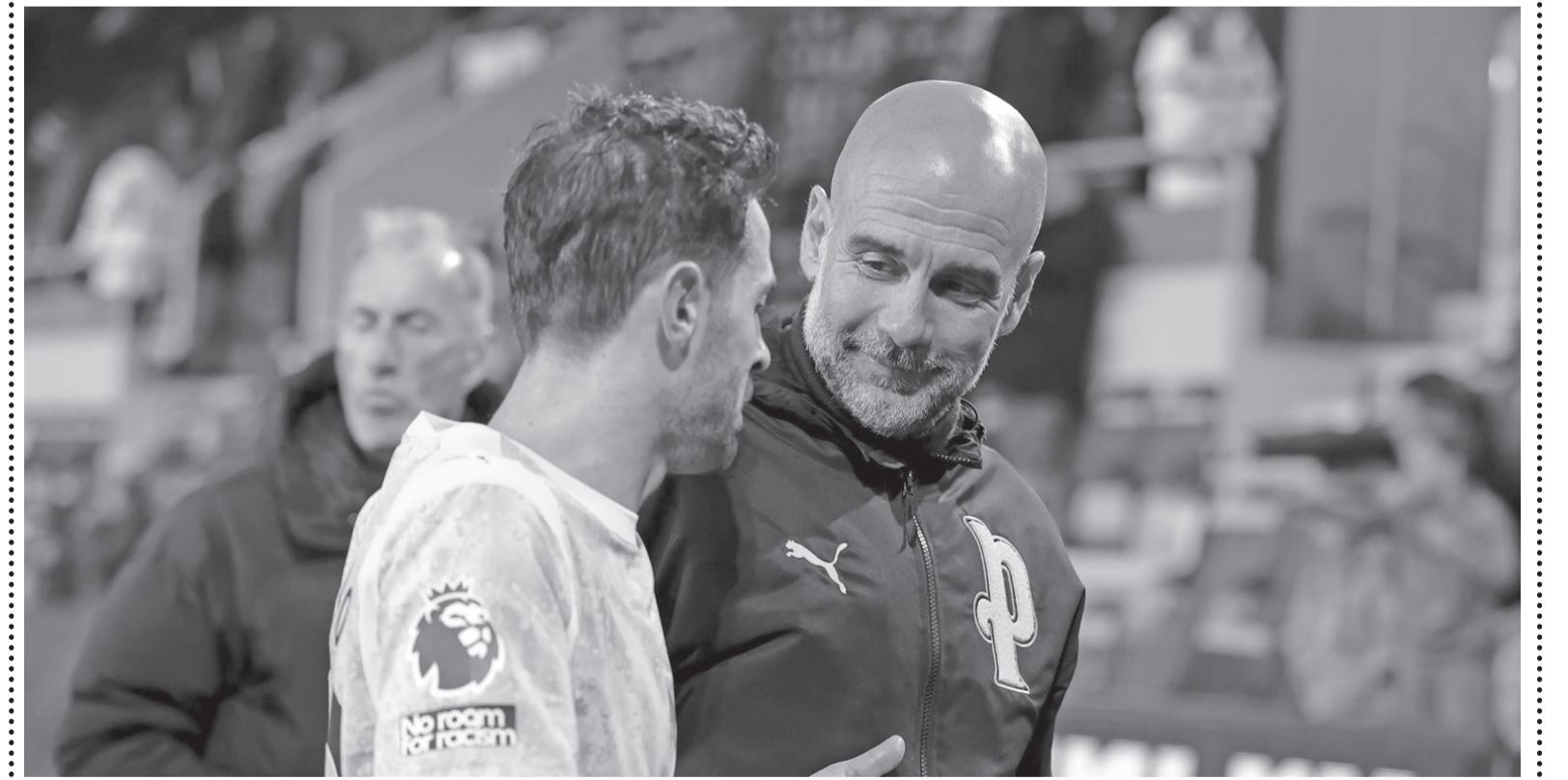
نضن البلد - وكالات

قبل خوض ٦ مباريات مصيرية خلال ٢١ يوماً فقط. غوارديولا يبتكر خطة «السفر والعائلة»، وتعليقاً على القرار الغريب، قال غوارديولا: «يمكنهم فعل ما يريدون، السفر إلى أي مكان، هم أحرار تماماً طالما عادوا للتدريبات عصر الأربعاء». وأضاف مفسراً فلسفته الجديدة: «لقد تعلمت في هذا البلد أنه كلما زادت أيام الراحة، لعب الفريق بشكل أفضل. يعتقد المدربون عادة أن زيادة التدريب تعني أداء أفضل، لكني أؤمن بالعكس تماماً. التدريب مهم بلا شك، لكن الأهم هو أن تصل ل موعد المباراة بذهن صاف وجسد نشط». واعترف غوارديولا بتحول قناعاته قائلاً: «في بداياتي كنت أدرب كثيراً، لكنني الآن أدرك أن العودة للمنزل وقضاء وقت عالي الجودة مع العائلة هو المفتاح».