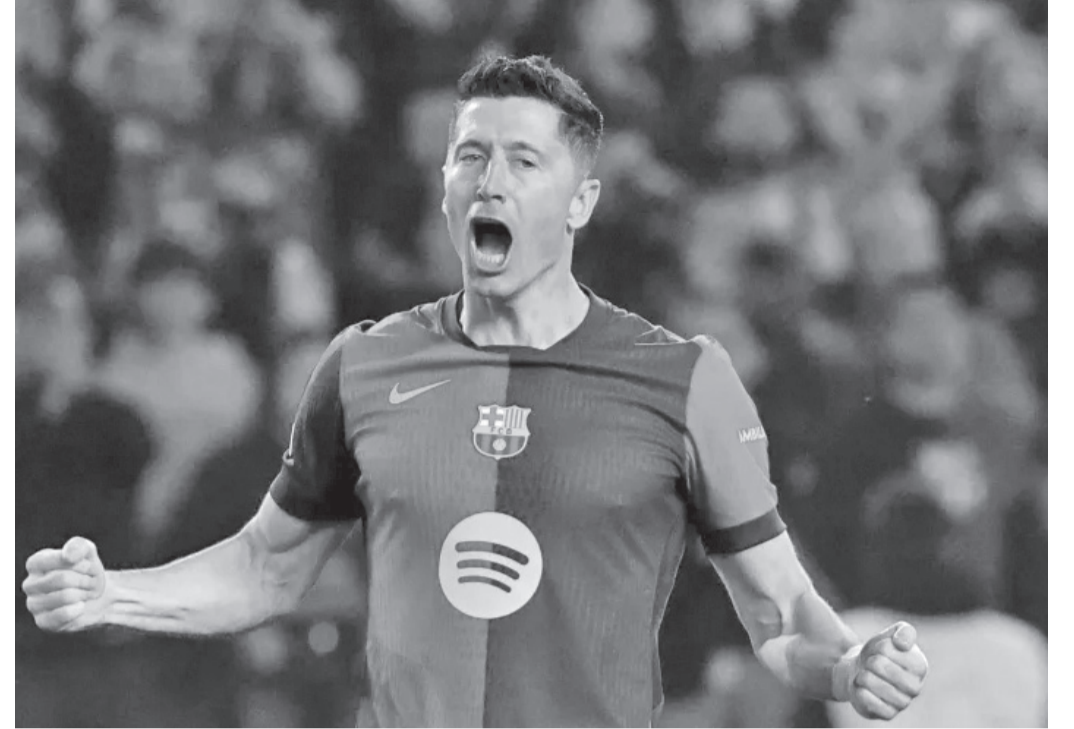
نضن البلد - وكالات

وتشير المعطيات الحالية إلى أن برشلونة يراقب بدقة وضع اللاعب مع أتلتيكو مدريد، خاصة بعد تألقه في المباريات الكبرى وقدرته على صناعة الفارق تحت الضغط. ومن المتوقع أن تبدأ المفاوضات الرسمية في حال استقرار ليفاندوفسكي على قرار الرحيل بشكل نهائي. ويأمل جمهور البلوغرانا أن تنجح الإدارة في حسم صفقة هجومية قوية تميد للفريق هيئته التهديفية وتساعد على المنافسة محلياً وإقليمياً بعد موسم شهد العديد من التحديات الفنية.