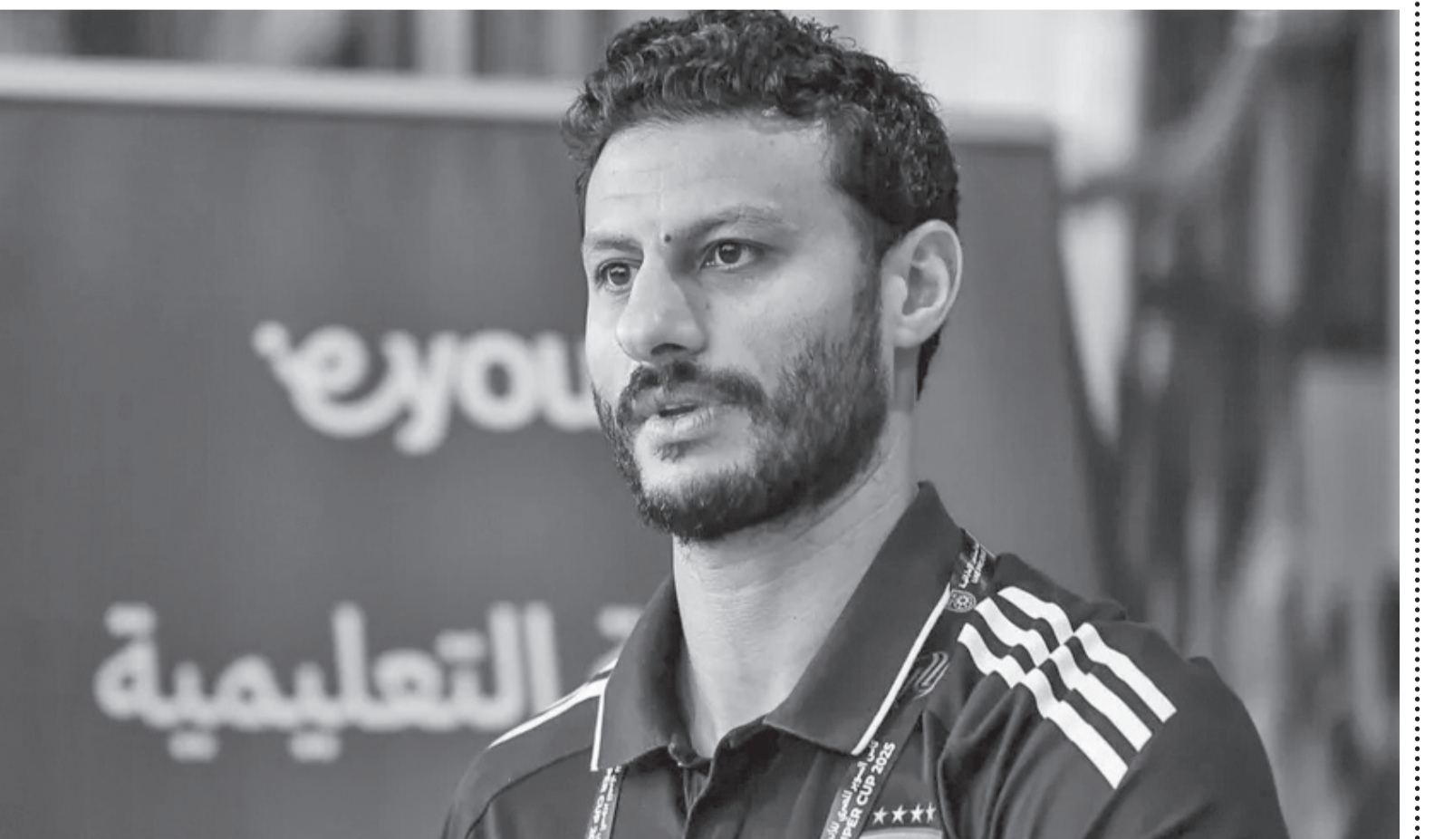
نضن