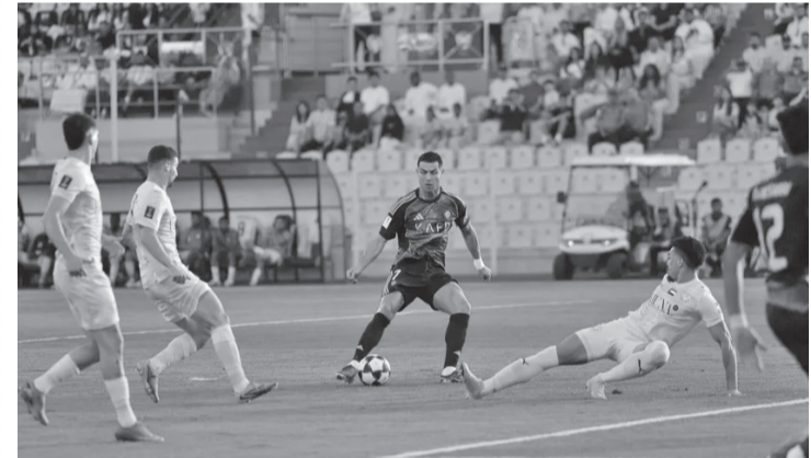
نضن البلد - وكالات

دوري روشن السعودي قبل آخر ٦ جولات، بجانب طموحه في البطولة الثانية على مستوى أندية آسيا، بعد أن عاندته الألقاب منذ وصوله للفريق الأصفر بعد مونديال ٢٠٢٢. وهذا أول هدف لرونالدو في بطولة دوري أبطال آسيا ٢، حيث اشترك في مباراة واحدة فقط من أصل ٨ مباريات سابقة، واكتفى بالظهور لمدة ٤٥ دقيقة خلال الانتصار ١-٥ على الزوراء، وصنع هدفاً. وتقدم النصر ٠-٣ في الشوط الأول بعد أن أضاف إنيغو مارتينيز وعبد الإله العمري هدفين بضربتي رأس.