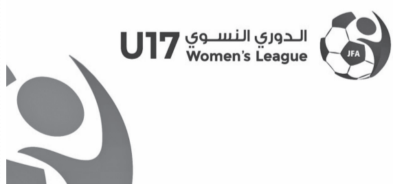
الأنياب - عمان

جانب منتخبات سلطنة عمان وباكستان والمالديف وبنغلاديش وتايلاند وقطر ومنغوليا، فيما تضم المجموعة الأولى منتخبات الصين وإيران والفلبين وهاونغ كونغ والهند وسريلانكا والبحرين. ويستهل المنتخب الوطني مشاركته في البطولة بعد غد الثلاثاء، بمواجهة منتخبى تايلاند والمالديف، قبل أن يلتقي مع باكستان يوم ٢٣، ثم يواجه بنغلاديش وقطر يوم ٢٤، ويلقي عُمان التحضيرى للدخول في أجواء المنافسات. ويلعب منتخبنا في المجموعة الثانية، إلى