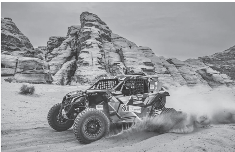
نضر البلد - عمان

وسيستنافس ١٥ مشاركا من فئة السيارات على نقاط كأس العالم لرائليات البهاا (فيا)، فيما يشارك ١٧ من أصل ٢٠ متسابقا متبقيين في كأس الشرق الأوسط لرائليات البهاا، التي تتكون من أربع جولات. وتتوزع المشاركات على ستة طواقم في فئة ”التيमित“، وسبعة في فئة ”تشانجر“، و١٥ في فئة ”إس إس في“، وسبعة في فئة ”ستوك“. أما فئة الاتحاد الدولي للدراجات النارية (فيم)، فتشهد مشاركة ٢١ دراجا في فئة الدراجات النارية، و٤ مشاركين في فئة الكواد، من بينهم ٧ دراجين