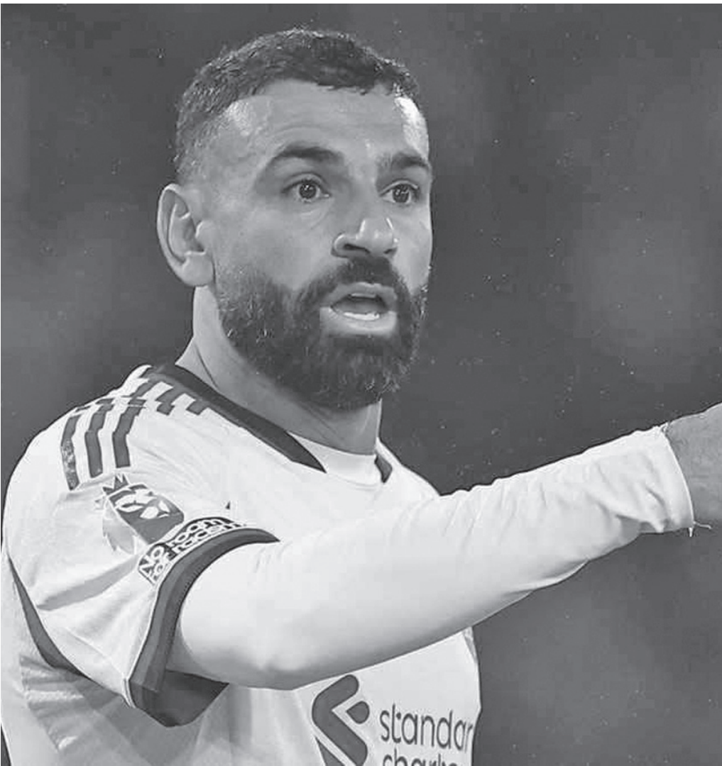
نضر البلد - وكالات