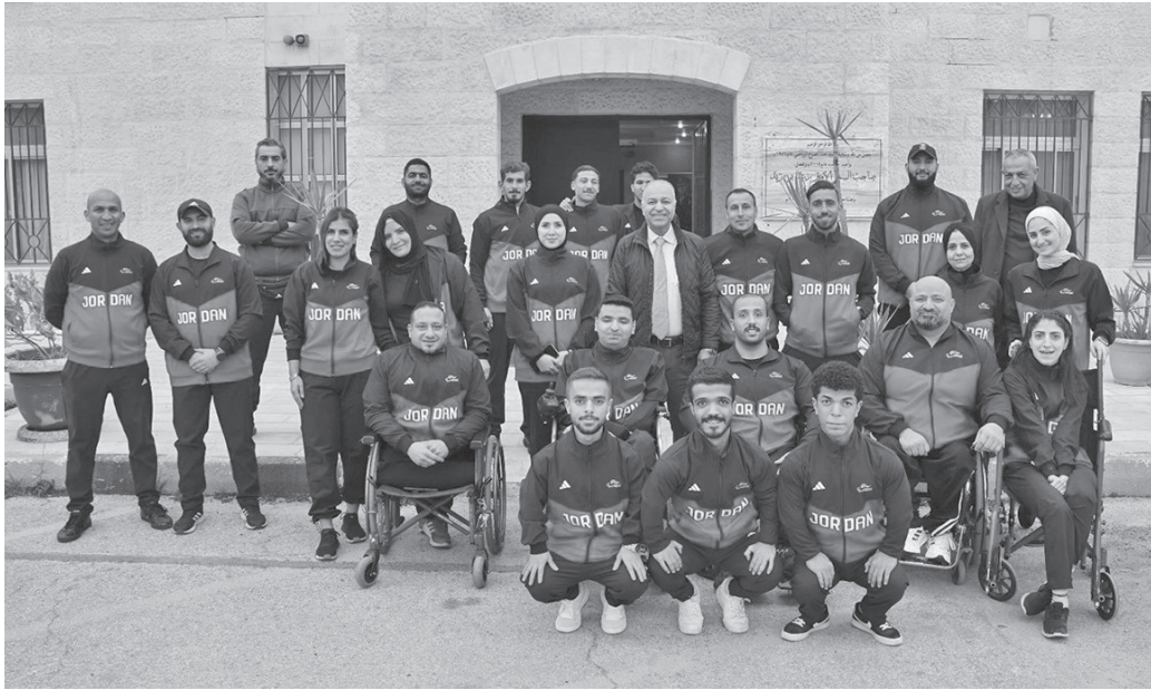
نض البلد- وكالات

ألعب غرب آسيا البارالمبية الخامسة التي استضافتها العاصمة العمانية مسقط، بحصيلة بلغت ١٤ ميدالية ملونة، أنهت المنتخب الوطنية البارالمبية مشاركتها في دورة