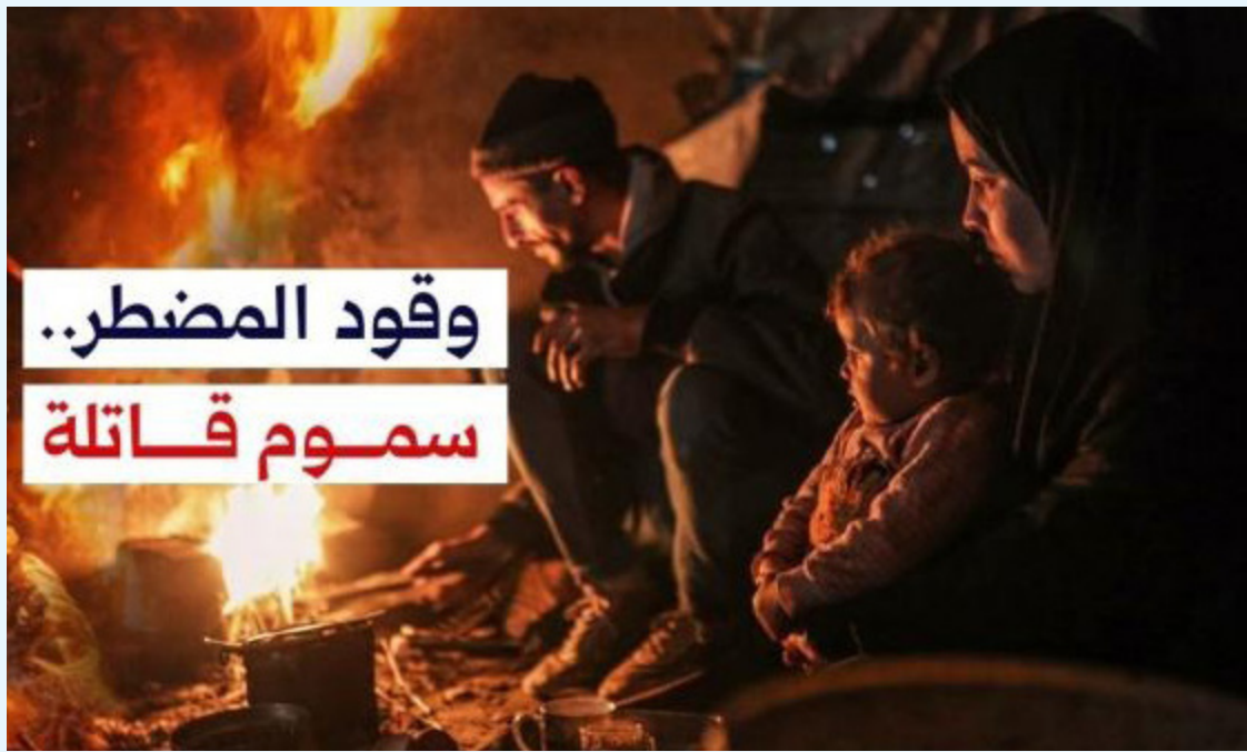
وقود المضطر.. سموم قاتلة