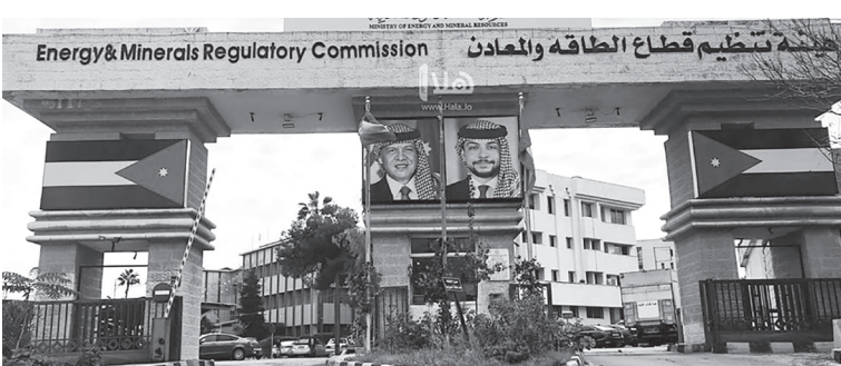
نض البلد - عمان

تلقت هيئة تنظيم قطاع الطاقة والمعادن، خلال تشرين الثاني الماضي، ١٢٢١ طلبا للحصول على تراخيص في مختلف القطاعات، رفض منها ٤ طلبات بقطاع النفط ومشتقاته. وبحسب بيانات الهيئة المنشورة على موقعها الإلكتروني، توزعت الطلبات بواقع ٣٢١ طلبا في قطاع العمل الإشعاعي والنووي، و٥٨٣ في قطاع المصادر الطبيعية، و٢٥٥ في قطاع النفط ومشتقاته، و٦٢ طلبا في قطاع الكهرباء والطاقة المتجددة.