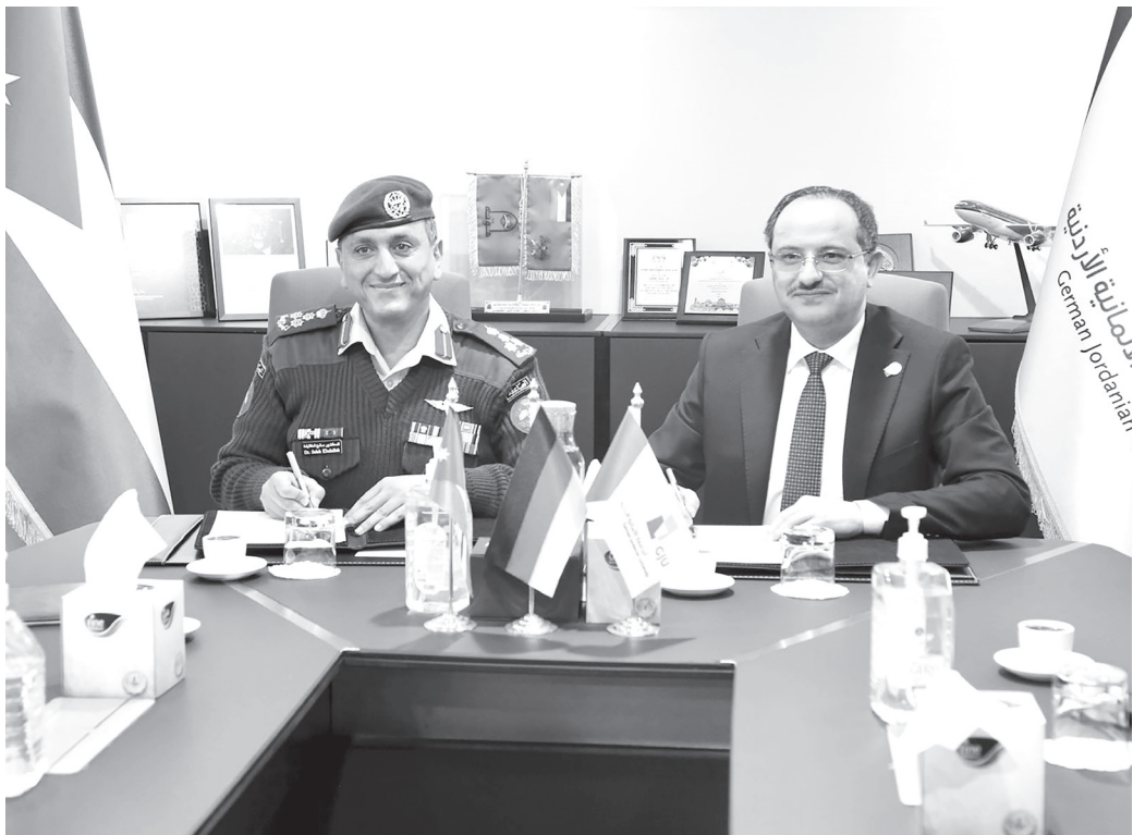
نض البلد - عمان

وقعت مديرية التربية والتعليم والثقافة العسكرية، امس الأحد، اتفاقية تعاون مع الجامعة الألمانية الأردنية، بهدف تعزيز الشراكة في مجالات التعليم والابتكار والتكنولوجيا والتحول الرقمي.