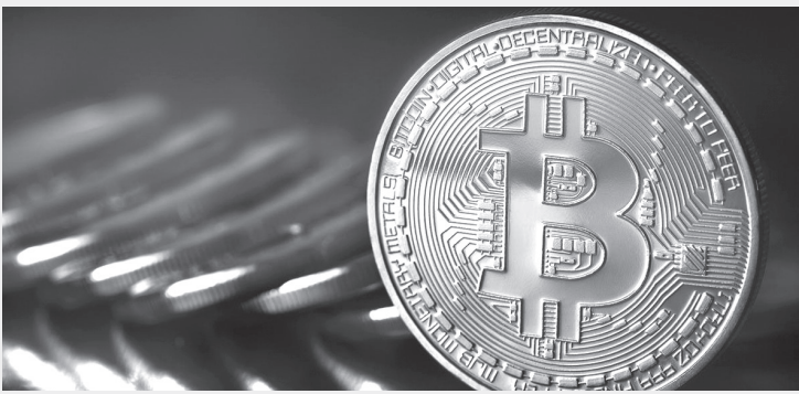
نبض لبلد – وكالات

ميناء، طلال الطيان إن الارتفاع الحالي في سعر عملة «بيتكوين، لا يعود إلى الأزمة في فنزويلا واعتقال الولايات المتحدة للرئيس نيكولاس مадورو، موضحا أن السبب الأبرز يتمثل في غياب البائعين من ديسمبر الماضي.