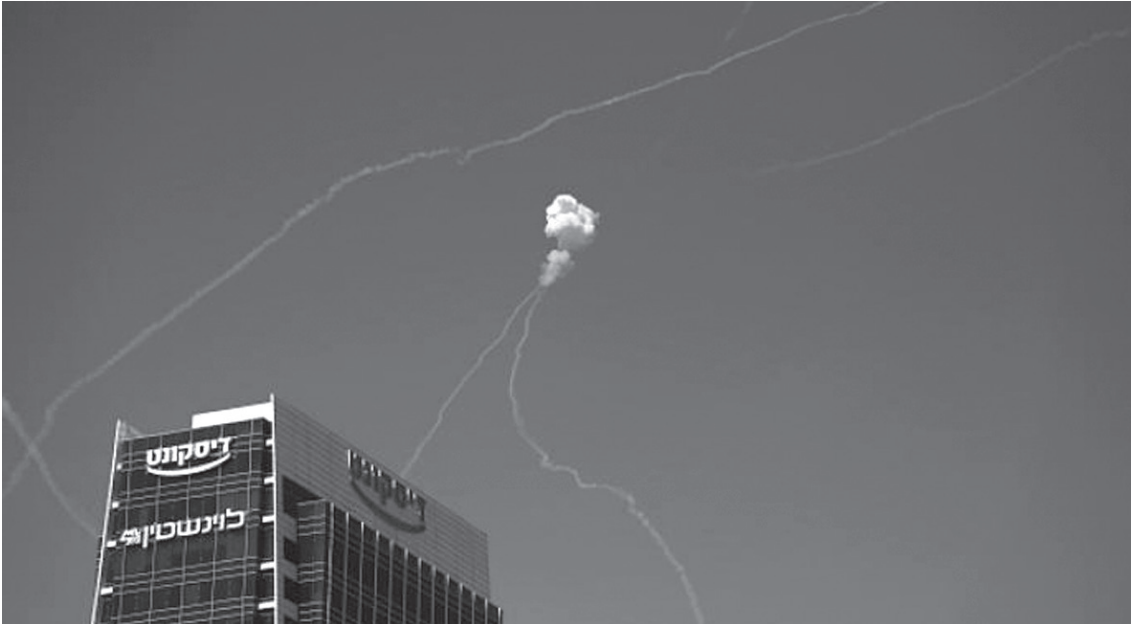
نبض البلد – وكالات

نشر مئات الأنظمة، بكلفة إجمالية تصل إلى مليارات الدولارات. وأشارت الصحفية إلى أن النشر الكامل للنظام سيكون طويلا ومكلفا للغاية، رغم الأموال المحقودة على خفض تكاليف الاعتراض. فصاروخ «تامير، الواحد، الذي يطلق من منظومة القبة الحديدية، تبلغ كلفته نحو 50 ألف دولار، في حين يؤكد مسؤولون عسكريون إسرائيليون أن عملية الاعتراض بالليزر لا تتجاوز بضعة دولارات. غير أن العقبة الأساسية تكمن في أن سعر كل جهاز توجيه ليزري قادر على تعطيل التهديدات الجوية يُقدَّر بعشرات الملايين من الدولارات. وفي السياق نفسه، أكد مسؤول عسكري إسرائيلي رفيع لصحيفة كالكاليست الاقتصادية أن الطريق نحو التنفيذ الكامل لهذا النظام لا يزال طويلا ومكلفا، نظرا لتعقيد عملية اعتراض التهديدات الجوية. وأضاف أن نظام الليزر الحالي يعمل بنسبة كفاءة تصل إلى 90%، لكنه لا يزال في طور التجربة، فضلا عن كلفته المرتفعة. وامتنعت