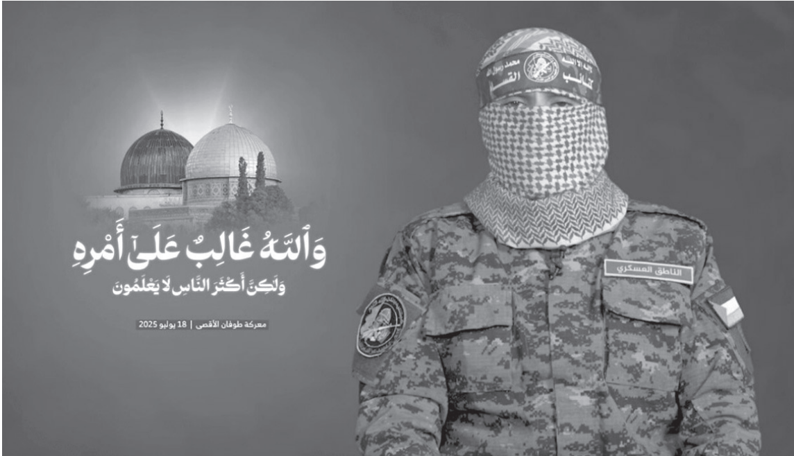
وَأَنَّهُ غَالِبٌ عَلَى أَمْرِهِ وَلَكِنَّ أَكْثَرِ النَّاسِ لَا يَعْلَمُونَ

أعلنت كتائب عز الدين القسام امس الاثنين رسميا استشهاد الناطق باسمها أبو عبيدة وكشفت عن اسمه الحقيقي لأول مرة. وجاء في بيان للكتائب «نعى القائد المثلثم أبو عبيدة باسمه الحقيقي حذيفة الكحلوت أبو إبراهيم الناطق باسم كتائب القسام». وشغل الشهيد أبو عبيدة مهمة الناطق باسم كتائب القسام لسنوات طويلة. وقد اكتسب زخما كبيرا على المستويين العربي والإسلامي، بعد عملية طوفان الأقصى، التي شنتها المقاومة الفلسطينية ضد قواعد ومستوطنات الاحتلال الإسرائيلي في ٧ أكتوبر/تشرين الأول ٢٠٢٣. وظل أبو عبيدة يروي تفاصيل وسير العمليات العسكرية للمقاومة وبيان المواقف في الجبهات، وكان على موعد شبه يومي مع شوب العالم، طيلة العامين الماضيين.