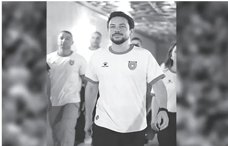
نبض البلد - عمان

هنا سمو ولي العهد الأمير الحسين بن عبدالله الثاني، منتخب النشامي بعد تحقيقه العلامة الكاملة في دور المجموعات ضمن منافسات كأس العرب، مؤكداً اعتزازه بالأداء المميز الذي قدمه اللاعبون خلال المباريات الثلاث. ونشر سمو ولي العهد عبر الأنستغرام : «بالعلامة الكاملة.. مبارك للأردن». وأكمل المنتخب الوطني الدور الأول بـ ٩ نقاط من ثلاثة انتصارات، ليضمن تأهله إلى ربع النهائي بعد ظهور لافت عزز حضوره في البطولة. وحقق النشامي فوز كبير على المنتخب المصري بثلاثة أهداف دون رد، في المباراة التي أقيمت مساء الثلاثاء على ستاد البيت في الدوحة، ضمن الجولة الثالثة من دور المجموعات، مظهر قدرة فنية عالية رغم إشراف عدد من اللاعبين البدلاء. ويتنظر النشامي في الدور ربع النهائي الخاسر من مواجهة الجزائر والعراق، في المباراة المقرر إقامتها يوم الجمعة المقبل.