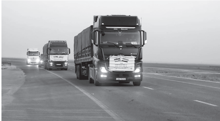
نبض البلد - عمان

سيرت القوات المسلحة الأردنية، أمس الثلاثاء، قافلة مساعدات غذائية إلى الجمهورية اليمنية الشقيقة، وذلك في إطار الجهود الإنسانية التي تبذلها المملكة لتخفيف من الظروف المعيشية الصعبة التي يمر بها الشعب اليمني. وضمت القافلة ١٣ شاحنة محملة بـ ٥٤٦٠٠ طرد غذائي، بهدف دعم الاحتياجات الأساسية وتقديم الإغاثة للمواطنين اليمنيين، ضمن مساعي الأردن المستمرة للوقوف إلى جانب الأشقاء ومساندتهم في مختلف الظروف. وتؤكد القوات المسلحة الأردنية، أن إرسال هذه المساعدات يأتي تنفيذاً لتوجيهات جلالة الملك عبدالله الثاني، القائد الأعلى للقوات المسلحة، وتجيئاً لنهج المملكة الثابت في خدمة القضايا الإنسانية وتعزيز التضامن العربي.