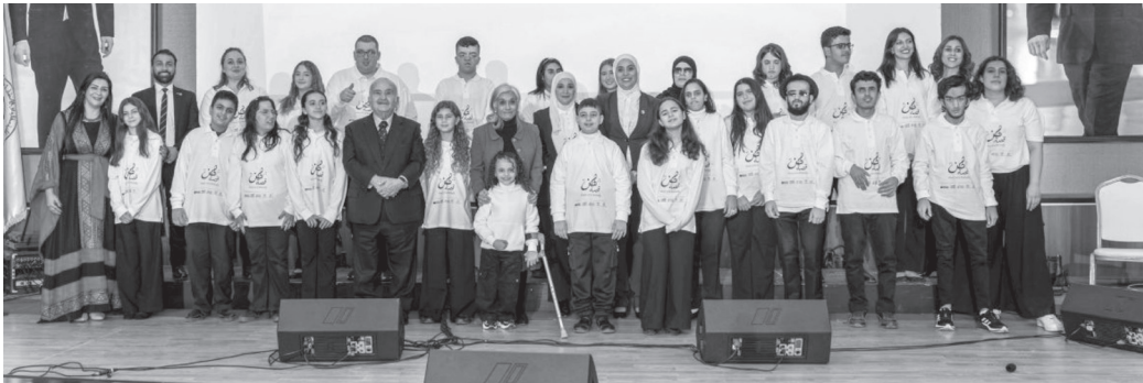
نبض البلد - عمان

برعاية سمو الأميرة ثروت الحسن والتضامن سمو الأمير الحسن بن طلال، وبالتعاون مع مركز البنيات للتربية الخاصة، أقيم مساء أمس الثلاثاء، حفل إطلاق جوقة «قصة لحن»، في أمسية فنية احتفت بالإبداع والشمولية، وأبرزت قوة التعبير الموسيقي المشترك كجسر للتواصل والاندماج. وشارك في الأمسية طلاب مركز البنيات وطلاب مدرسة البكالوريا بعمان (ABS)، إلى جانب مجموعة من الفنانين والموسيقيين من ذوي الإعاقة وغيرهم، ضمن مساحة فنية جمعت مختلف القدرات والخواص، وعززت قيم التعاون والمساواة وإتاحة الفرصة للجميع للتعبير من خلال الموسيقى. وجاءت مشاركة سموهما تجسيدا لاهتمامهما المستمر بقضايا التعليم وتمكين الأطفال والشباب، ولا سيما ذوي الإعاقة، ودعمهم للوصول إلى منصات الإبداع والمشاركة