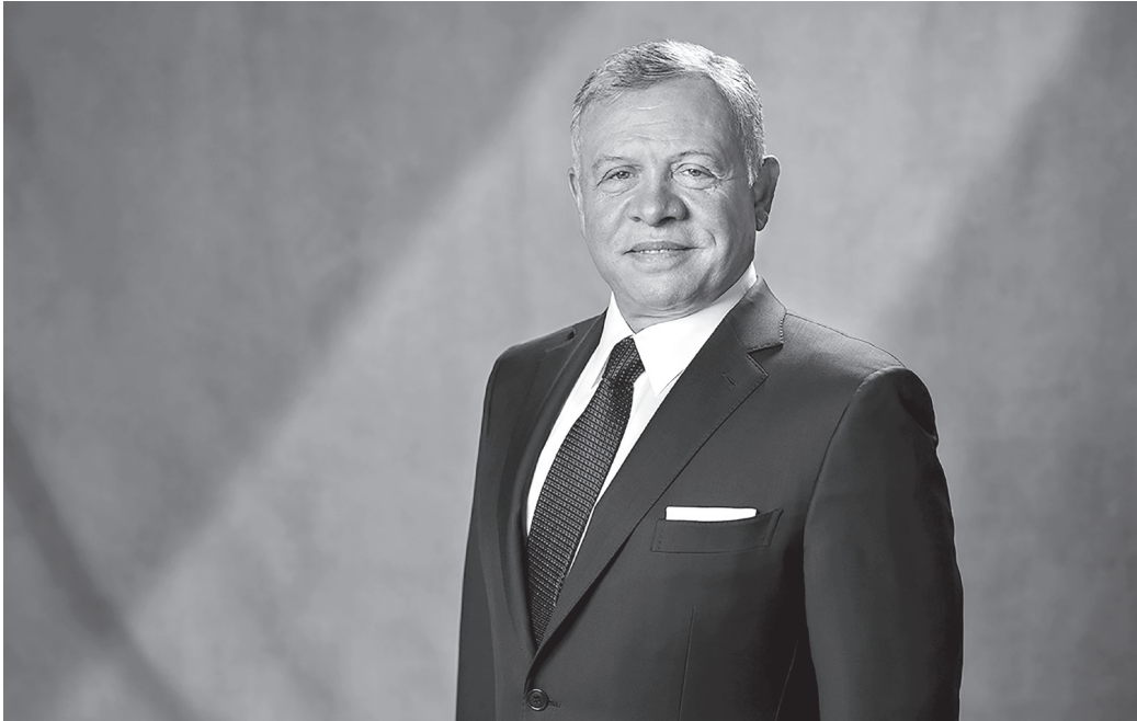
نبض البلد - المغطس

ترأس جلالة الملك عبدالله الثاني ورئيس الوزراء الألباني إيدي راما، أمس الثلاثاء، جولة جديدة من مبادرة «اجتماعات العقبة»، بتنظيم مشترك مع ألبانيا، عقدت في موقع عمّاد السيد المسيح، عليه السلام، (المغطس). وركزت الجولة، التي تعقد للمرة الرابعة حول دول البلقان، على سبل تعزيز الحوار بين الأديان والتأكيد على القواسم المشتركة لتعزيز الأمن والسلام. واتفق المشاركون في نهاية الاجتماعات، على أن المسؤوليات المشتركة أمام المجتمعات في البلقان تتطلب تعزيز قيم التعاون الأخوي والتفاهم والاحترام بينها. ولفتوا إلى أن القواسم المشتركة يجب أن تكون ركيزة أساسية ومرجعية لتعامل هذه المجتمعات مع بعضها بحس من المسؤولية والتضامن، من أجل مستقبل شعوب الشرق الأوسط وأوروبا. وشارك في الاجتماعات، التي حضرها سمو الأمير غازي بن محمد، كبير مستشاري جلالة الملك للشؤون الدينية والثقافية، المبعوث الشخصي لجلالته، قيادات دينية إسلامية ومسيحية من ألبانيا، والبوسنة والهرسك، وبلغاريا، وكرواتيا، واليونان، وكوسوفو، ومقدونيا الشمالية، وسلوفينيا، ورومانيا، وصربيا، وهنغاريا، ومونتينيغرو (الجيل الأسود)، إضافة إلى القدس، وسوريا، والأردن. ومنذ انطلاق «اجتماعات العقبة» بمبادرة من جلالة الملك قبل ١٠ سنوات، عقدت جولاتها السابقة في الأردن،